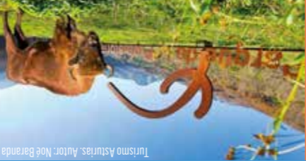
Turismo Asturias.